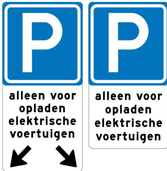
Bebording bij openbare laadvakken