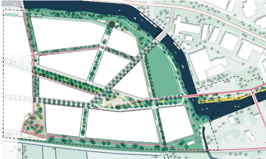
Plankaart De Suikerzijde deelgebied Noordoost