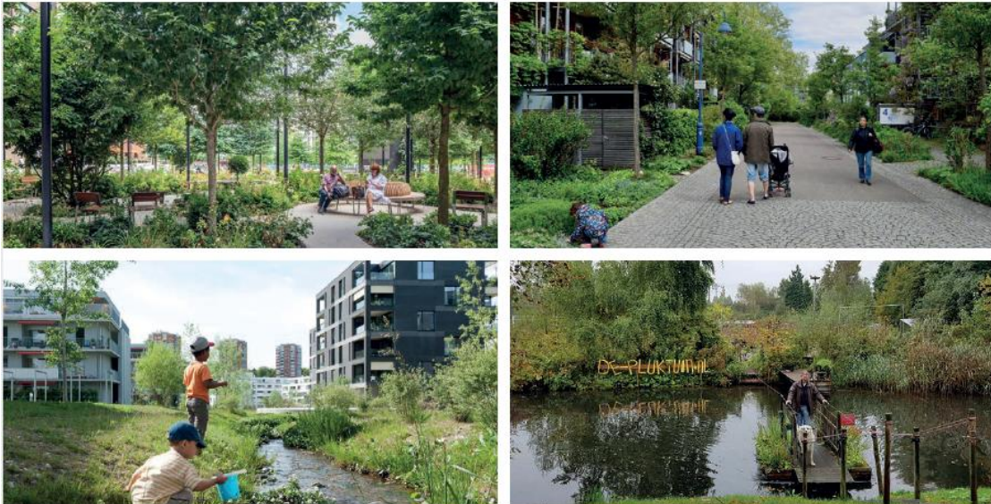
Referentiebeelden inrichting openbare ruimte De Suikerzijde

De algemene Plaatselijke Verordening Groningen (APVG 2021) en de Beleidsregels APVG Behoud van groen: kap en herplant (2021) bevatten regels voor een (financiële) compensatieplicht. De APVG 2021 en de beleidsregels bieden echter ook de mogelijkheid geen formele groencompensatie-verplichting op te nemen waar het gaat om houtopstanden die in de afgelopen jaren spontaan zijn gegroeid. Van deze zogenoemde ‘kan’ bepaling maken we gebruik (“hardheidsclausule”). In uitzonderlijke gevallen kunnen we namelijk van de herplantverplichting afwijken en maatwerk leveren. Als specifiek voorbeeld wordt in de toelichting op artikel 4 van de beleidsregels de situatie genoemd dat een bouwlocatie een lange tijd niet gebruikt wordt en er vervolgens bomen groeien. Deze situatie doet zich in De Suikerzijde nadrukkelijk voor.