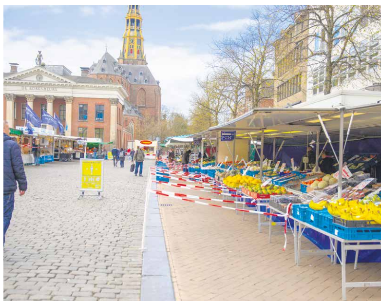
De markt in de nieuwe opstelling.

Nadat de coronacrisis losbarstte, namen de marktmeesters al direct maatregelen. “Eerst trokken we de markt een klein stukje uit elkaar. Dat ging an sich goed. Toen werd het echter mooi weer en gingen mensen allemaal naar buiten. Op zaterdag 4 april leek de markt daardoor erg vol.”