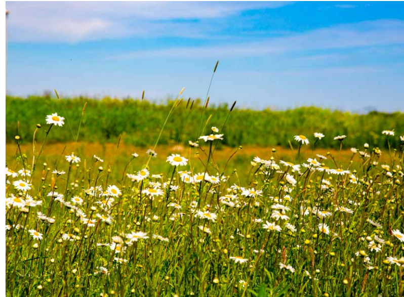
Berm in Euvelgunne

Wil je meer informatie over het groenbeleid van de gemeente? Kijk op gemeente.groningen.nl/groenplan .