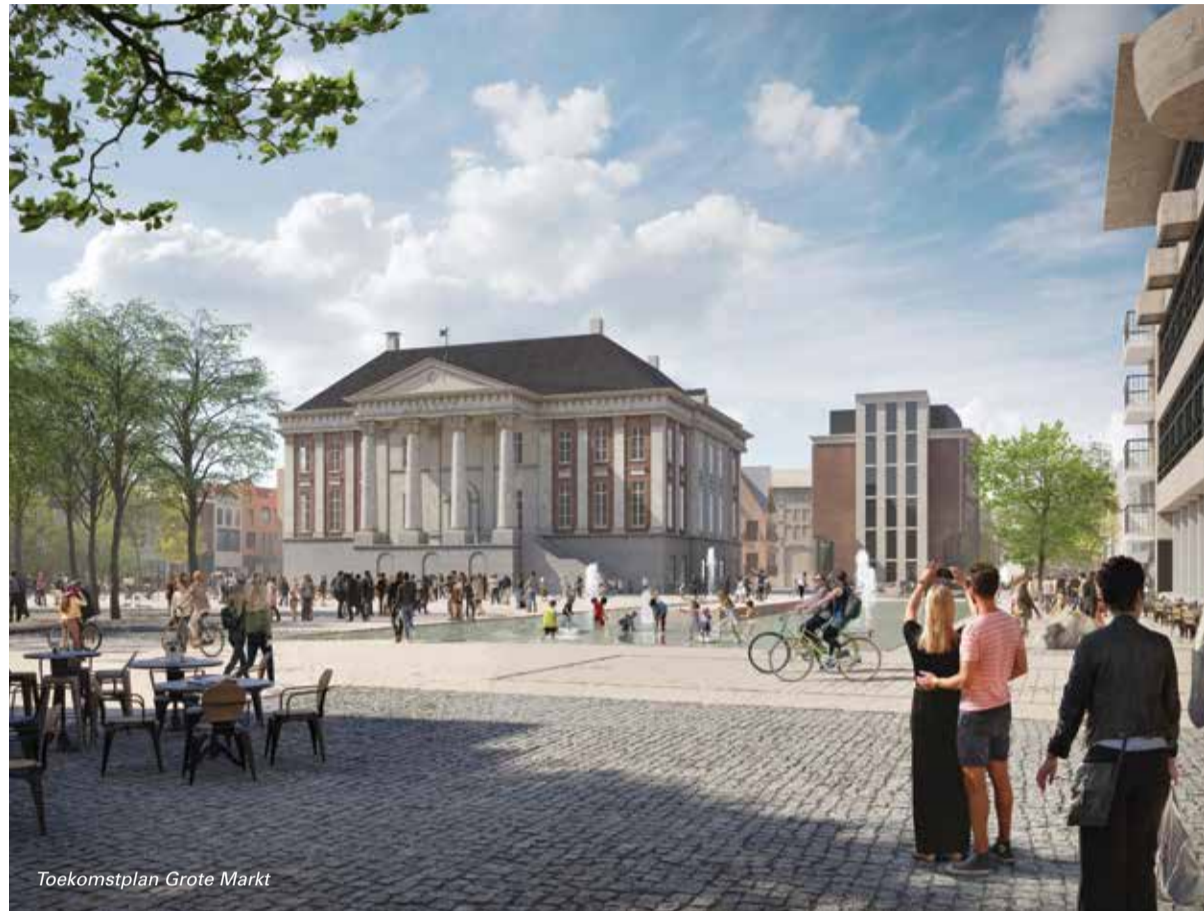
Toekomstplan Grote Markt

De komende weken worden gebruikt om het concept-inrichtingsplan te bespreken met inwoners en belanghebbenden. Daarna worden in het ontwerp de puntjes op de i gezet. Eind dit jaar neemt de gemeenteraad een besluit over het definitieve voorstel. De uitvoering van het plan kan dan in het voorjaar van 2022 starten. Wil je meer weten over het concept-inrichtingsplan voor de Grote Markt? Kijk dan op jouwgrotemarkt.groningen.nl . Je vindt daar het ontwerp, verbeeldingen, plattegronden en nog veel meer. Ook kun je via deze website op het concept-inrichtingsvoorstel reageren. Op de Grote Markt zelf staan er tot 27 september grote informatieborden, die het ontwerp ook laten zien.