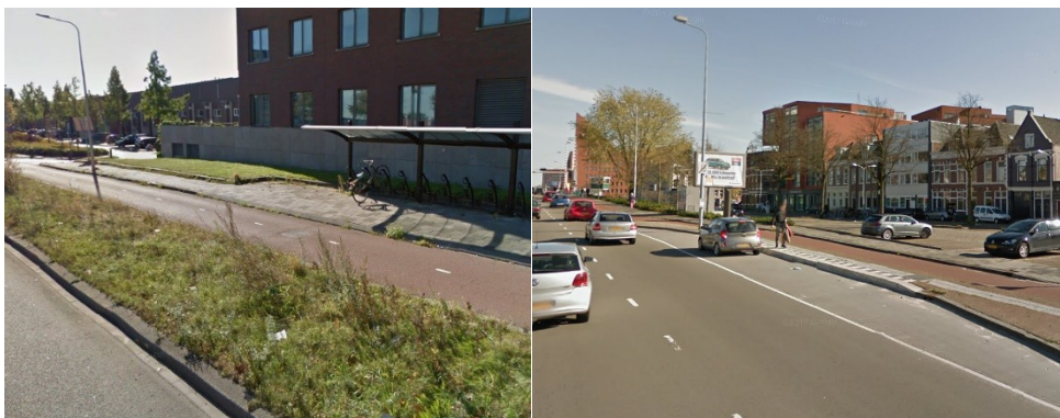
Figuur 2 Locatie Europaweg/Sontweg (links) en locatie Europaweg/Damsterdiep (rechts)

De locatie is momenteel in gebruik als bushalte, waarbij buslijn 171 nu twee keer per uur halteert. Hierover is contact geweest met het OV-bureau en Qbuzz. Zij geven aan dat het voornemen is om deze halte per december uit de dienstregeling te halen met als gevolg dat deze halte vrij is voor liftgebruik.