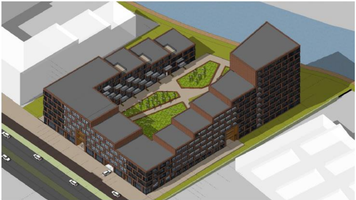
Figuur 2.2: Impressie van de nieuwbouw

Het plan behelst 153 woningen/appartementen.