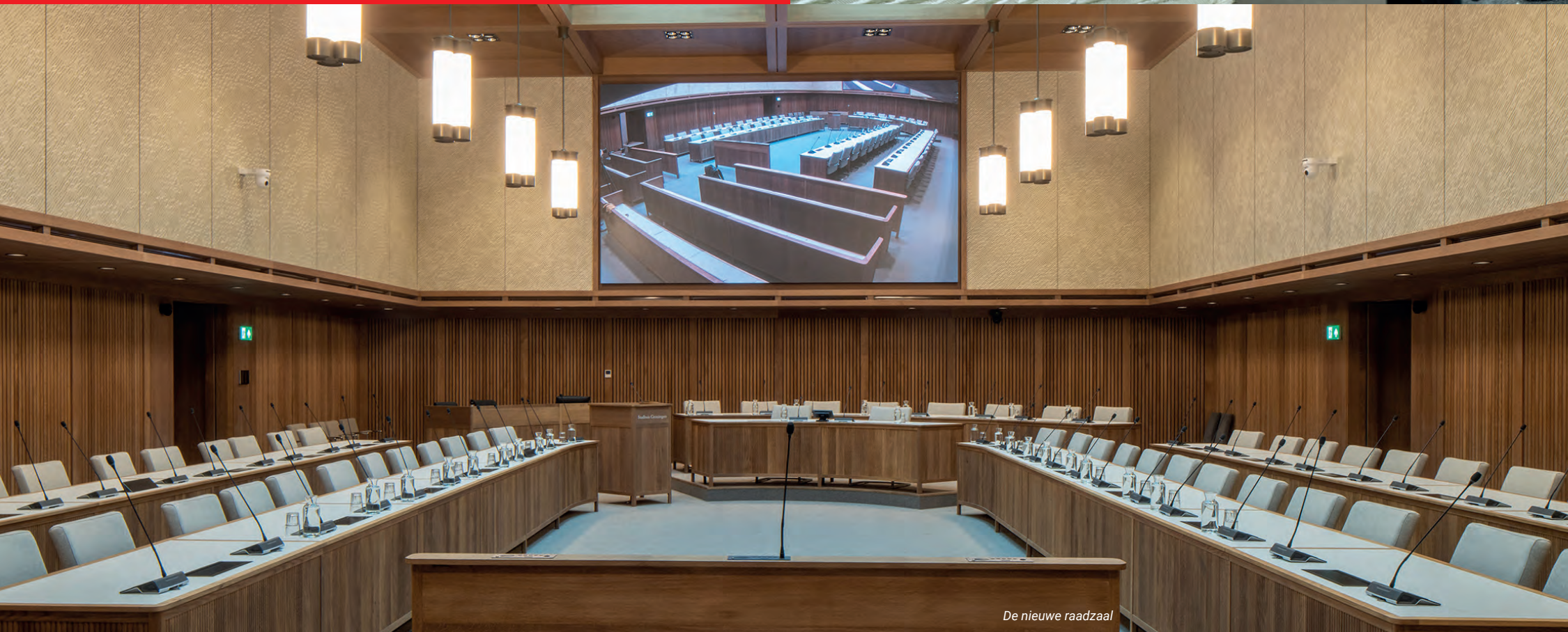
De nieuwe raadzaal

OUDE RAADZAAL Tot 1997 vonden in deze zaal raadsvergaderingen plaats. Een statig vertrek dat in veel opzichten nog de 19e eeuw ademt. Gestucte plafonds, rijk versierde kroonluchters en alles onder het toezien oog van vroegere burgemeesters. De Latijnse spreken boven de deuren manen de raadsleden rechtvaardig te oordelen en herinneren hen eraan burgers van de stad en vreemdelingen gelijk te behandelen.