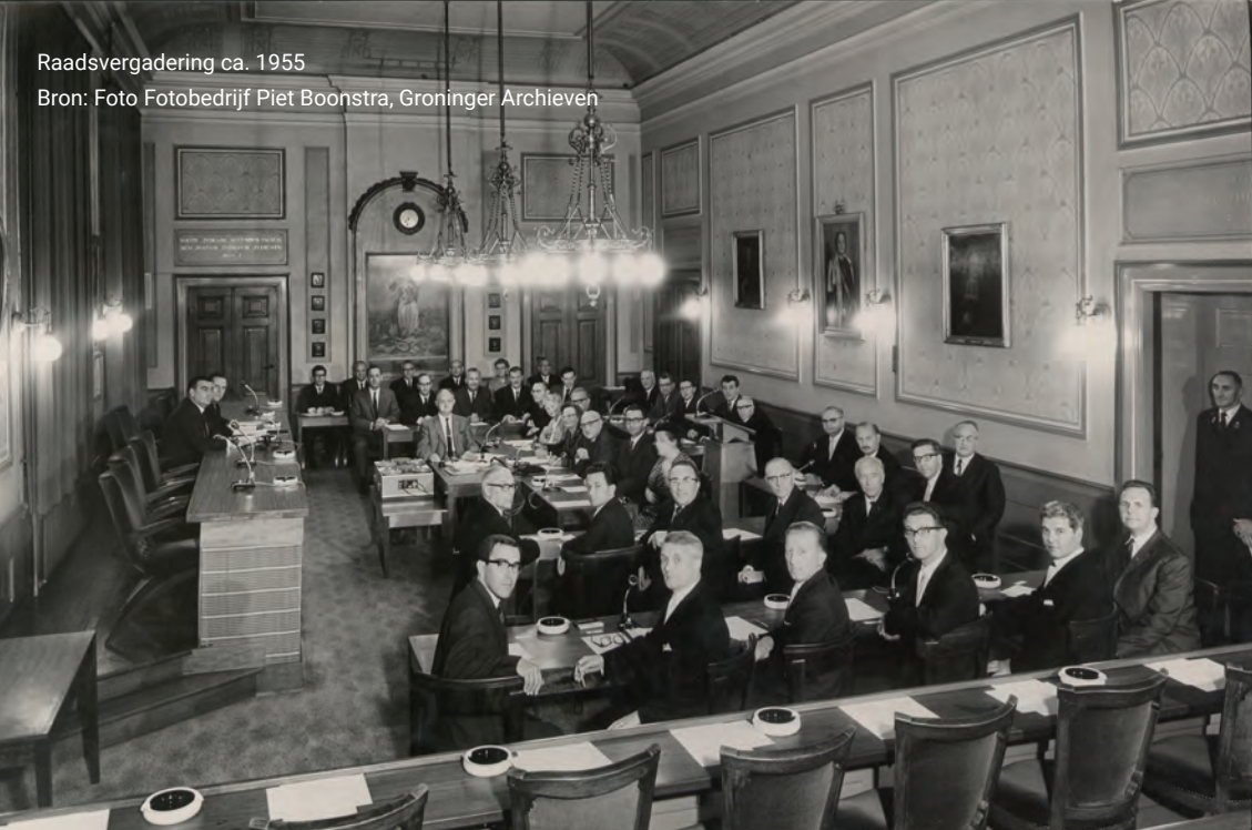
Raadsvergadering ca. 1955

STEDENMAAGD Otto Eerelman schilderde in 1920 De Stedenmaagd. Ze verbeeldt de stad die in 1878 werd bevrijd uit de vestingwallen. In haar handen houdt ze daarom gebroken ketenen. Het is een allegorische ode aan handel, nijverheid, kunsten en wetenschappen. In een vitrine onder dit schilderij dat in de oude raadzaal hangt, ligt het 'Gulden Boek der stad Groningen'. Hierin staan de namen van alle ereburgers.