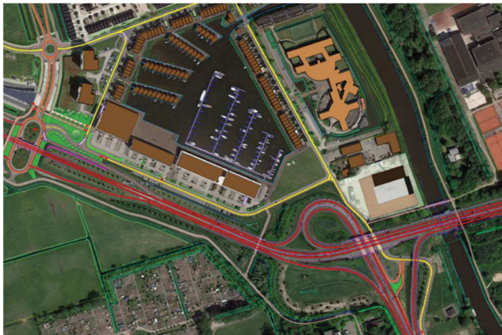
Ontsluiting Reitdiephaven (ovonde)