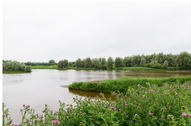
Ontwerp compensatiegebied 1