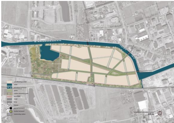
Stedenbouwkundig plan deelgebied noord

Begin juni 2021 heeft uw raad de Structuurvisie De Suikerzijde en het bestemmingsplan voor deelgebied noord vastgesteld. De ontwikkeling van De Suikerzijde start in deelgebied noord, en geeft daarmee uitvoering aan het stedenbouwkundige plan.