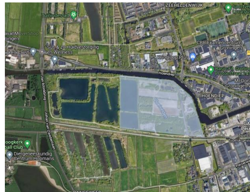
Gebied uitvoering eerste fase

Het noordelijke deelgebied van in totaal 57 ha wordt gefaseerd tot ontwikkeling gebracht. Hiervoor willen we komend najaar aan de oostkant met het grondwerk beginnen. Om deelgebied noord te kunnen ontwikkelen tot een uitgebalanceerd en compleet nieuw stadsdeel, is natuurcompensatie nodig voor beschermde diersoorten die gebruik maken van de voormalige vloeivelden. Hiervoor is een ontheffing van de Wet natuurbescherming (Wnb) nodig. Provincie Groningen is hiervoor het bevoegde gezag.