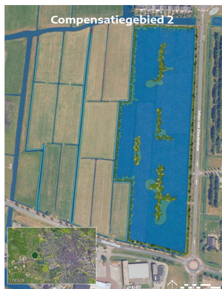
Weidevogelgebied (groen); compensatiegebied 2 (rode cirkel) Ontwerp tweede compensatiegebied

Om de weidevogels zo veel mogelijk te ontzien, willen we het tweede compensatiegebied direct langs de Johan van Zwedenlaan aanleggen. Langs de Johan van Zwedenlaan zitten in de huidige situatie de minste weidevogels, omdat de weg verstrend werkt. In de aangrenzende weilanden maken we voor weidevogels plasdrasgebieden en een brede sloot als barrière voor predatoren, waarmee dit gebied geschikter voor weidevogels wordt. Het overige weidegebied van De Oude Held wordt door de aanleg van het compensatiegebied niet beïnvloed. Wij streven ernaar dit tweede compensatiegebied in het najaar van dit jaar aan te leggen. De uitvoering is dan voor het broedseizoen van 2023 klaar. Zo krijgt het gebied tijd om als compensatiegebied te kunnen functioneren voordat met werkzaamheden aan de westkant van deelgebied noord begonnen wordt.