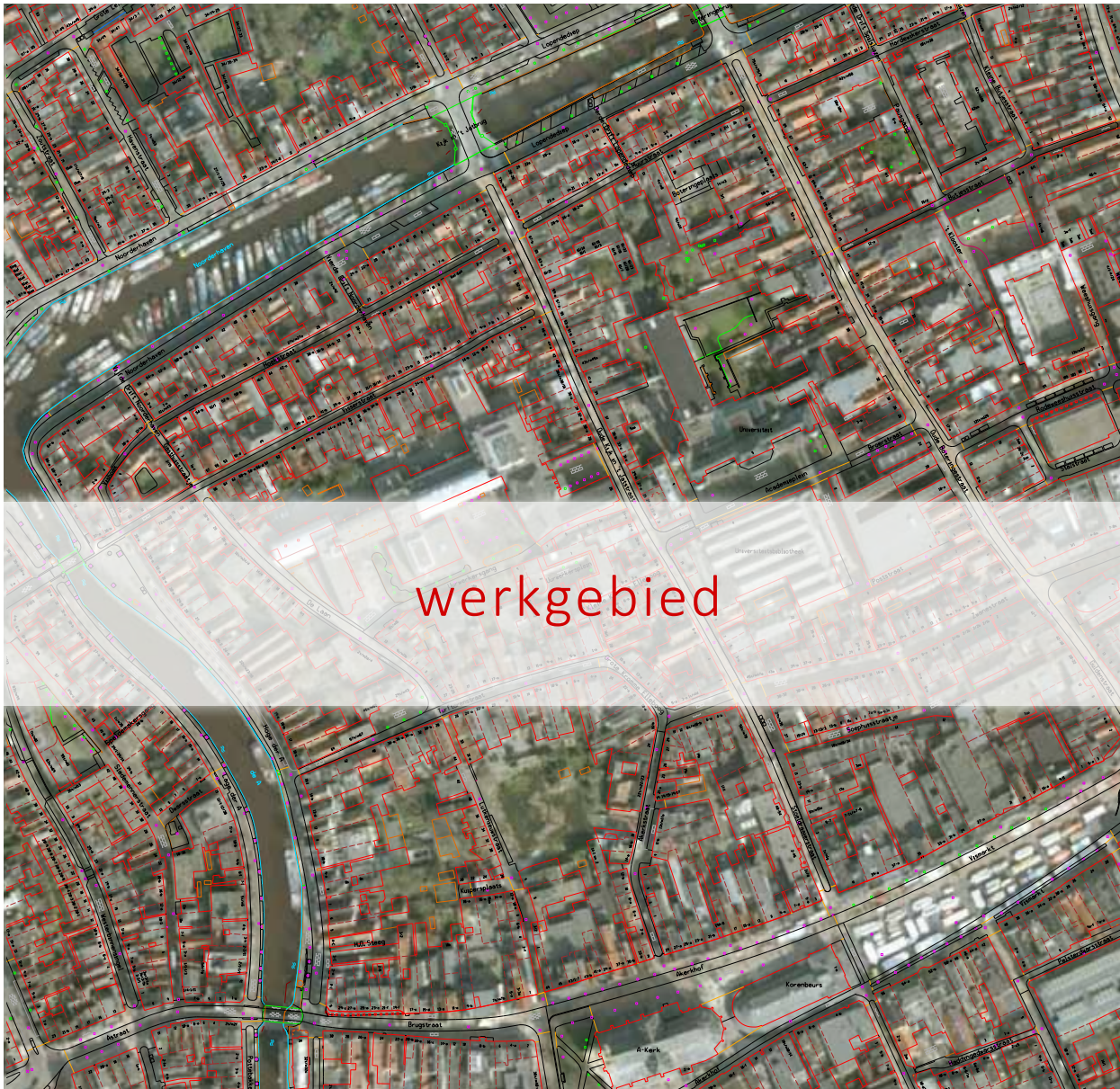
noordwestelijk deel binnenstad Groningen