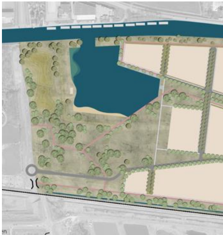
Park in stedenbouwkundig plan

als recreëren, ontspannen en sporten. Deze planwijziging heeft tevens tot gevolg dat een bouwveld in het noordwesten van deelgebied noord komt te vervallen. Ook is de opgave voor verkenning van de realisatie van drijvende woningen in het park, zoals opgenomen in het bestemmingsplan voor deelgebied noord, niet te combineren met de compensatieopgave voor vleermuizen. Onderstaande eerste schetsontwerp voor het parkgebied wordt de komende periode uitgewerkt en geconcretiseerd.