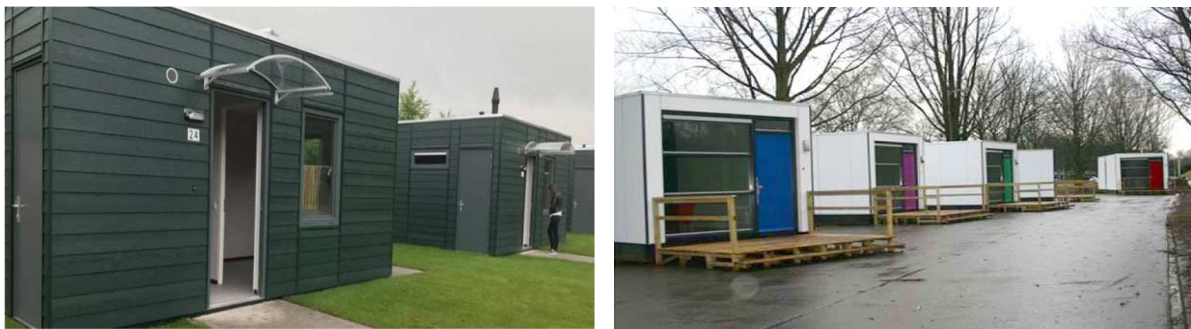
Figuur 1 Voorbeelden van Skaeve Huse

In ons land zijn sinds 2005 al diverse projecten geïnspireerd door het Deense concept gerealiseerd. In 2010 zijn de eerste ervaringen geëvalueerd, met positieven resultaten.