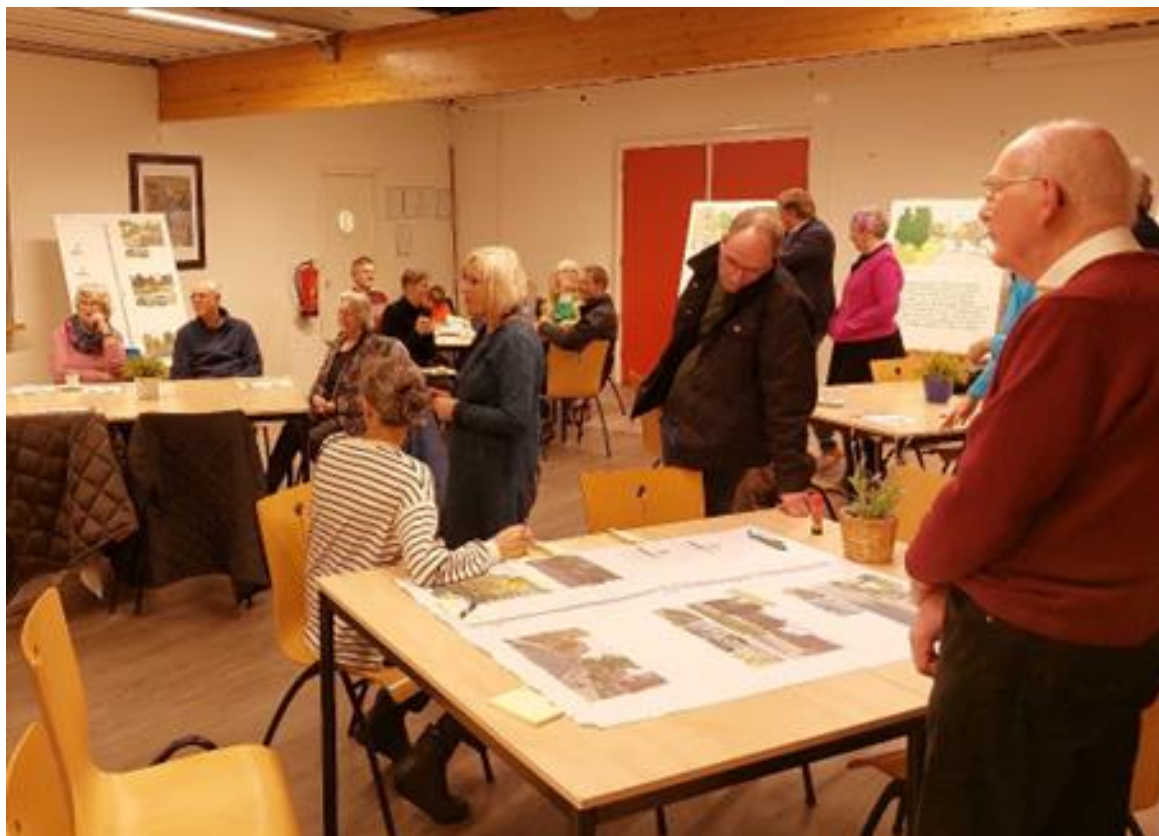
Tweede inloopbijeenkomst Voermanstraat, november 2023

De aanwezigen konden tijdens de avond langs een route van informatiepanelen op schildersezels kennis nemen van de laatste stand van ontwerp en de wijze waarop de opmerkingen tijdens de eerste avond daarin zijn verwerkt. Bij elke informatiepaneel stond iemand van de gemeente of de klankbordgroep om een toelichting te geven. De bewoners konden met post-its hun opmerkingen achterlaten op de panelen of op de grote kaart op de centrale tafel. Daar is veel van gebruik gemaakt, zie onderstaande foto's.