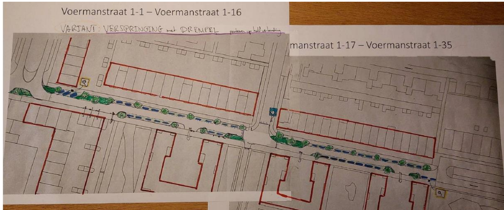
Eerste schetsen i.o.m. klankbordgroep bewoners voor verkeersveiliger Voermanstraat, nov. 2022

Voor de Voermanstraat (Paddepoel-zuid) was vanaf 2022 (tot het heden) een klankbordgroep van bewoners in gesprek met de gemeente vanwege zorgen in de straat over de verkeersveiligheid. Volgens de bewoners wordt er erg hard gereden door auto's en scooters, wat leidt tot onveilige situaties. Voordat sprake was een warmtenet door de straat, liepen hierover al gesprekken tussen de gemeente en bewoners. In dat kader waren ook al de eerste schetsen gemaakt (zie hieronder).