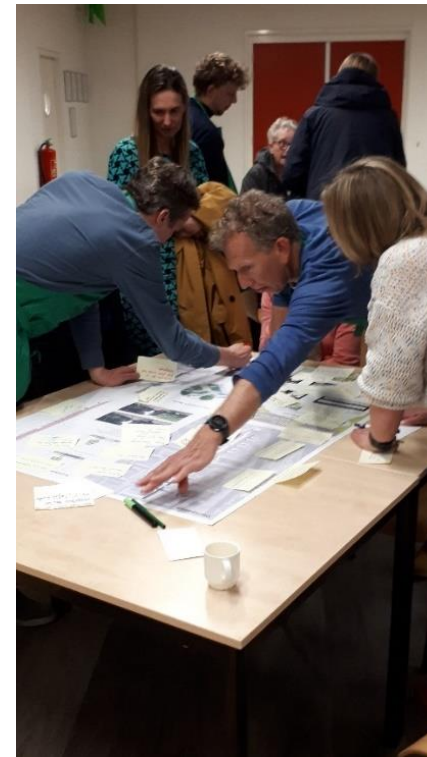
Eerste inloopavond, april 2023

Van de eerste inloopavond is een participatieverslag gemaakt die is gepubliceerd op de wijkwebsite. In dat verslag werden de reacties tijdens de avond gebundeld in categorieën en voorzien van reacties van de klankbordgroep / gemeente.