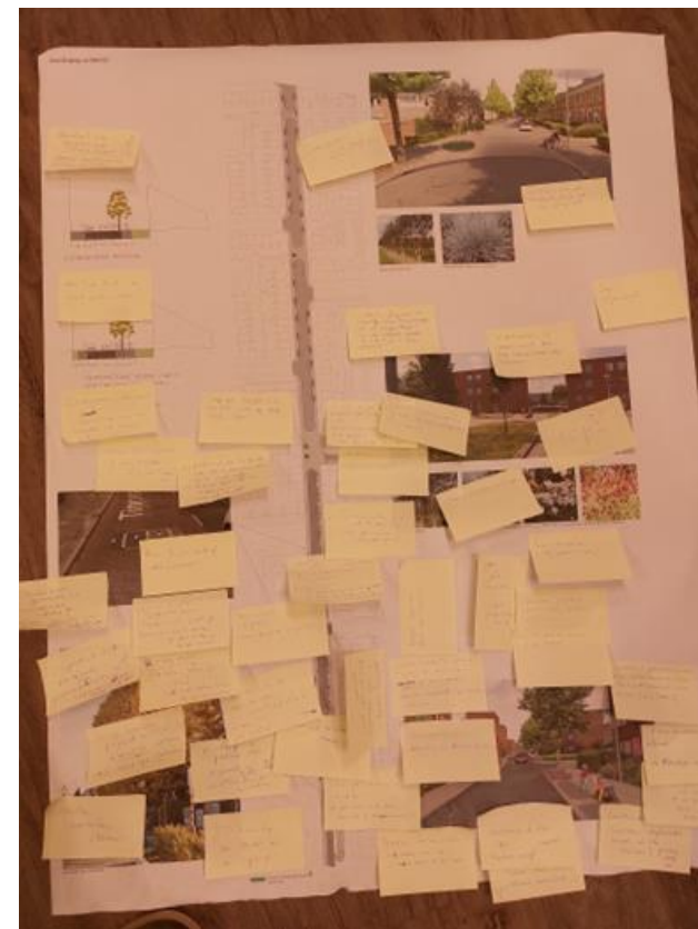
Post-its van bewoners, november 2023