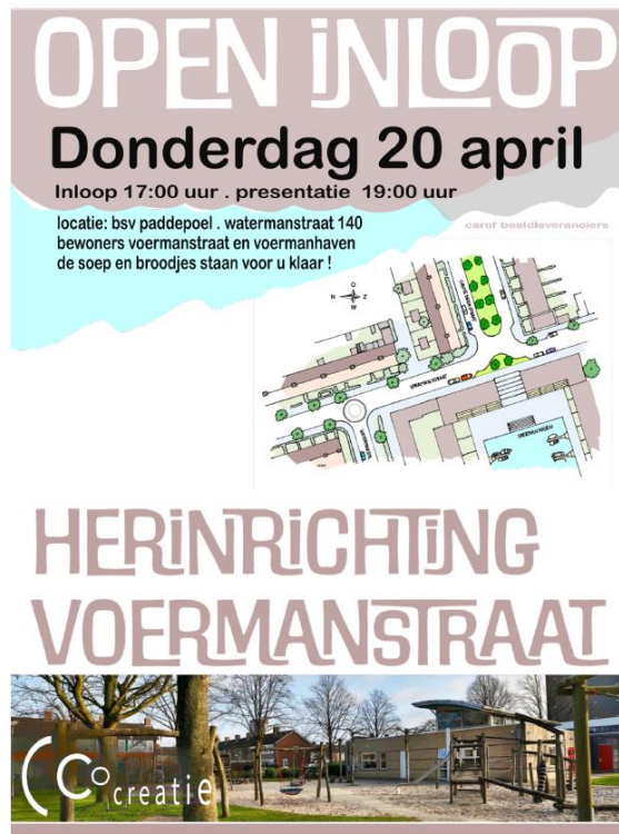
Flyer eerste inloopavond, april 2023

Over dat schetsontwerp vond in april 2023 een eerste brede inloopavond plaats met de omgeving in BSV De Waterman. Hierover is breed gecommuniceerd met huis-aan-huisbrieven en publicaties in de wijkkrant. De inloopavond werd goed bezocht door ca. 50-60 bewoners. Zij hebben met post-its op kaarten veel waardevolle suggesties achtergelaten.