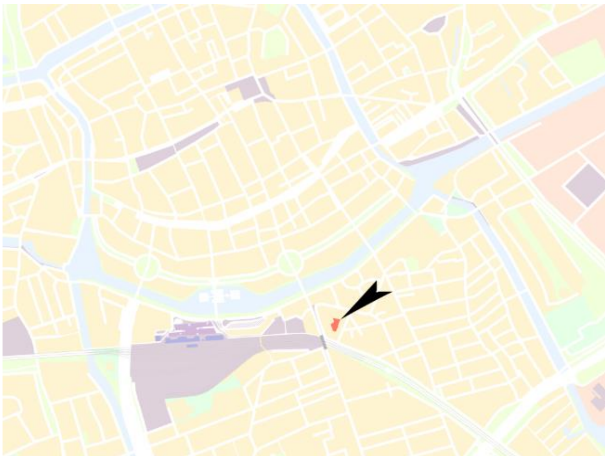
Figuur 1 : ligging plangebied op stadsniveau

Dit bestemmingsplan vervangt een klein deel van het bestemmingsplan Oosterpoort. Onderstaande figuur laat het gebied zien waarvoor dit bestemmingsplan van toepassing is. Het plangebied betreft een binnenterrein, geheel omsloten door bestaande bebouwing.