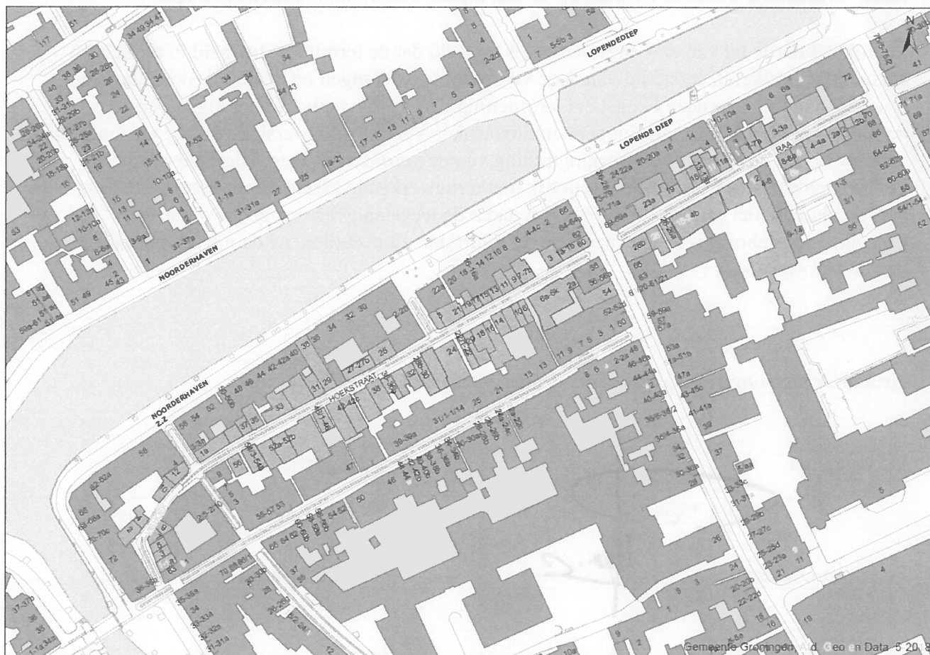
Kaart: Werkingsgebied leegstandverordening gemeente Groningen 2018

Het werkingsgebied betreft panden geadresseerd in de Vishoek, Hoekstraat en Muurstraat zoals hieronder in het rood op kaart weergegeven: