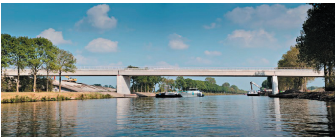
Voorbeeld van een brug zonder bovenbouw: Hogewegbrug Zuidhorn (in N355)