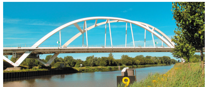
Voorbeeld van een brug met bovenbouw: Walfridusbrug