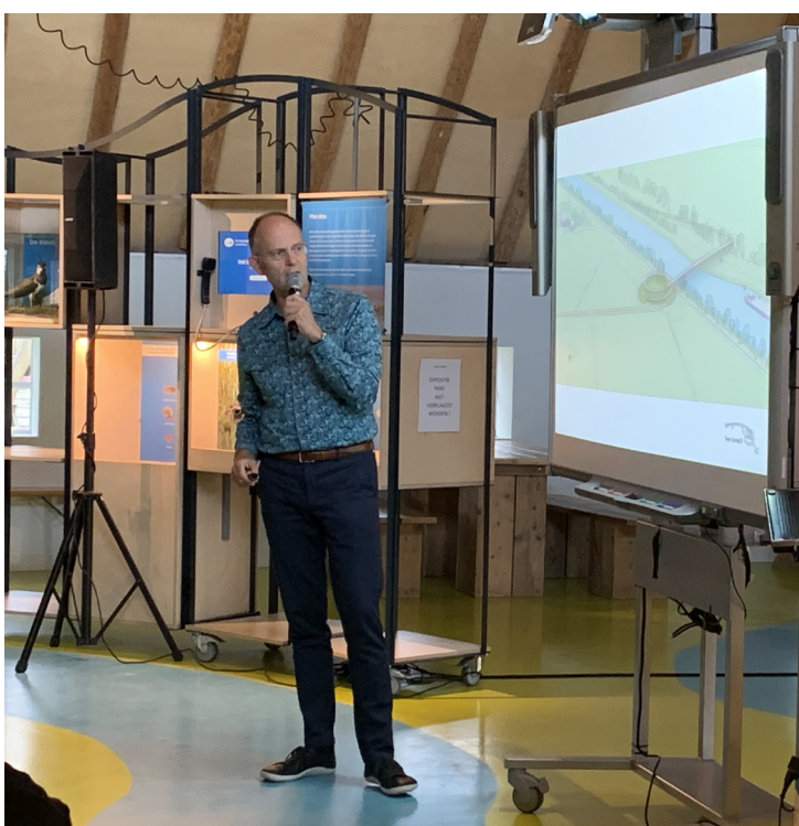
Joris Smits van Ney & Partners