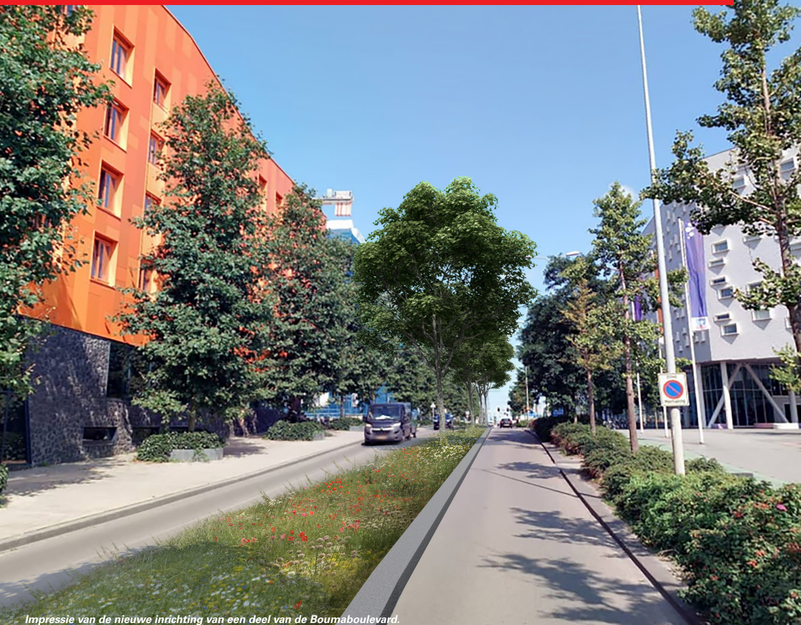
Impressie van de nieuwe inrichting van een deel van de Boumaboulevard.