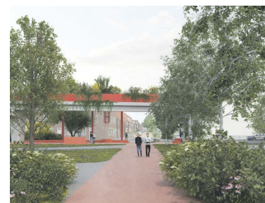
Impressie (Studio LA) van het Geheugenpaviljoen bij het Wlnschoterdiep

De inloopbijeenkomsten in het Poortershoes zijn op 23 van 16:30 – 20:00 uur en 24 januari van 10:00 – 12:30 uur. De gemeente organiseert die samen met de projectorganisatie Aanpak Ring Zuid. Aan de aanleg van dat plantsoen wordt momenteel gewerkt door aannemer Combinatie Herepoort. Het Geheugenpaviljoen is onderdeel van het ontwerp van het Zuiderplantsoen. Het park is 1100 meter lang en komt op de verdiepte ligging van de ringweg, tussen de Verlengde Hereweg en het Winschoterdiep. Of de bouw van het Geheugenpavil-