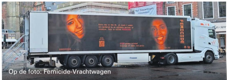
Op de foto: Femicide-Vrachtwagen