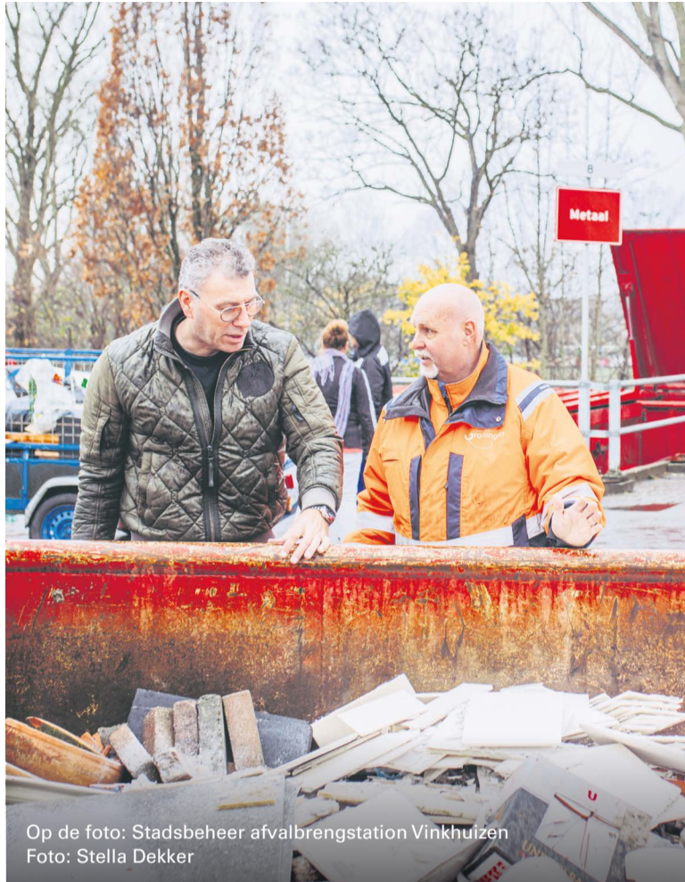
Op de foto: Stadsbeheer afvalbrengstation Vinkhuizen

Onderzoeksbureau CE Delft ontdekte dat gemiddeld 34% van onze milieulast komt uit de aankoop van nieuwe spullen. Dus heb je het echt nodig? Kun je het tweedehands kopen of ergens lenen? Is het kapot? Repareer het dan in plaats van direct een nieuwe te kopen. Bespaart niet alleen grondstoffen, maar ook veel geld! En als je het echt weg moet gooien, bied het op de juiste plek aan. Papier in de papiercontainer, glas in de glascontainer, etc. En alles wat niet in de container hoort, kun je vier keer per jaar gratis naar de afvalbrengstations brengen. Zo worden het weer grondstoffen voor nieuwe producten.