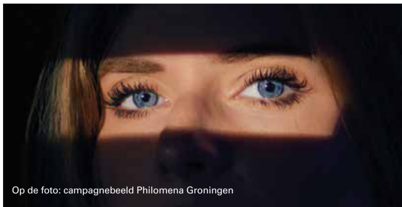
Op de foto: campagnebeeld Philomena Groningen