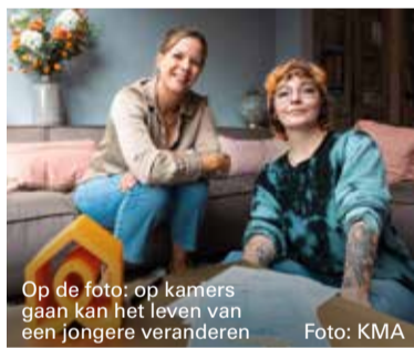
Op de foto: op kamers gaan kan het leven van een jongere veranderen