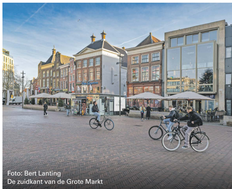
De zuidkant van de Grote Markt

Wil je meer informatie over de nieuwe maatregel? Ga dan naar jouwgrotemarkt.groningen.nl .