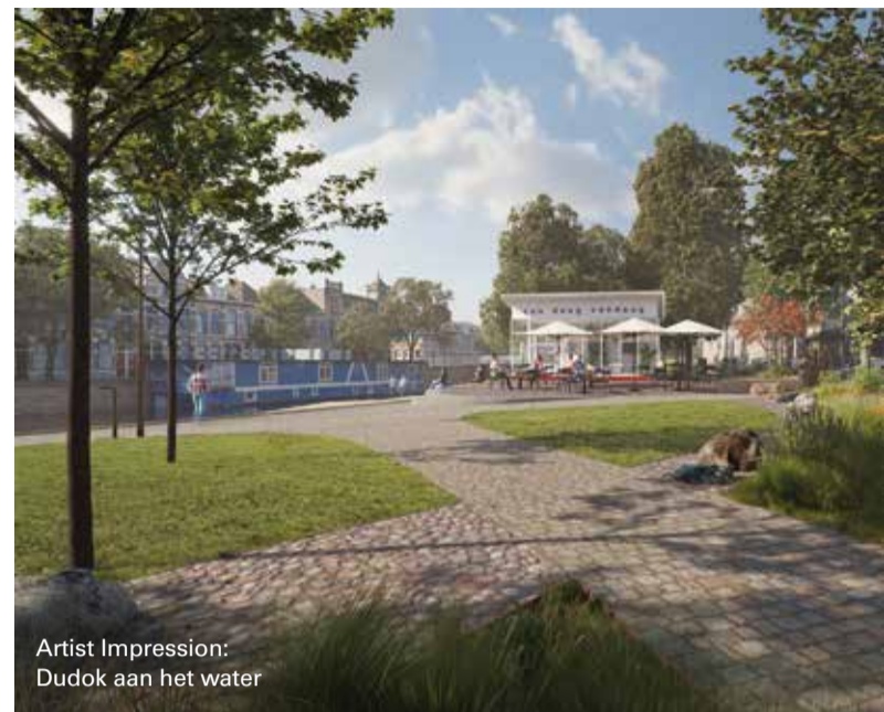
Artist Impression: Dudok aan het water

Later dit jaar start ook de restauratie van dat witte gebouwtje ernaast. Niet voor niets, want het gaat hier om een van de twee overgebleven benzinestations in Nederland, zoals