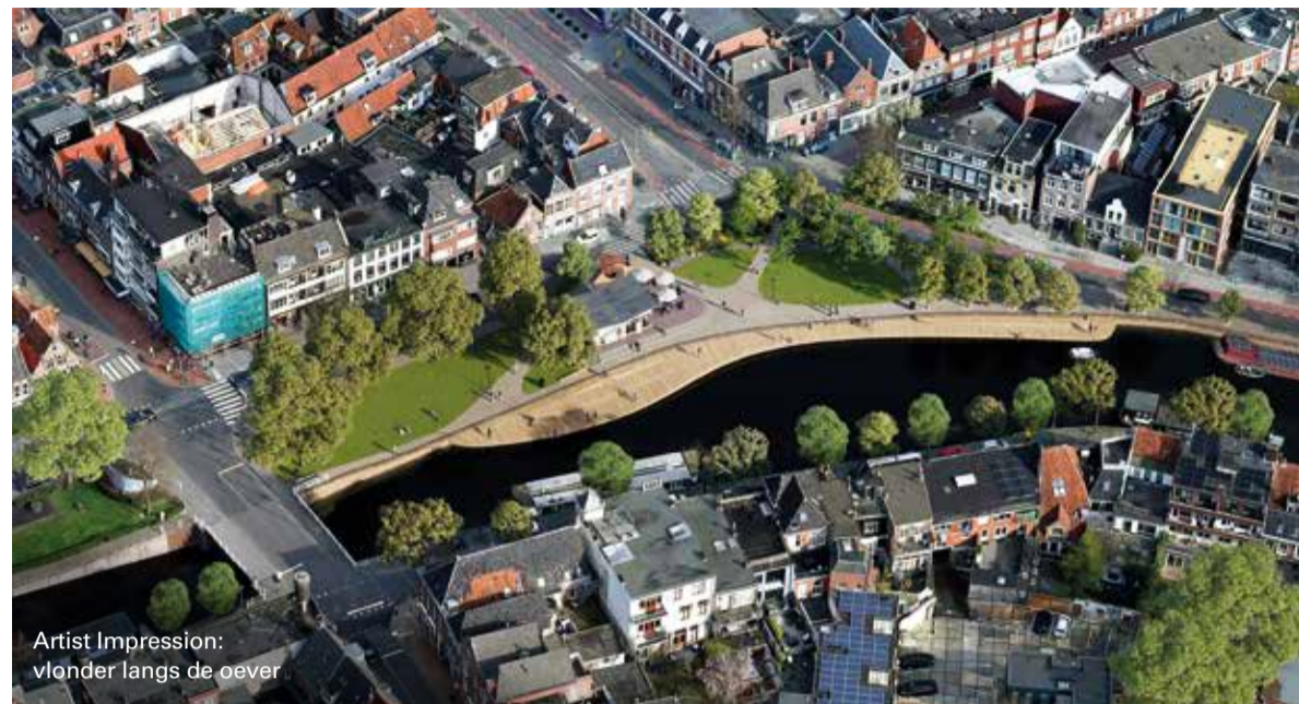
Artist Impression: vlonder langs de oever

U kent het vast wel, dat hoekje aan de Turfsingel waar ooit het BIM-benzinestation in bedrijf was. Met dat mooie witte gebouwtje ernaast. Benzine wordt er al jaren niet meer getankt. De plek raakte vervallen en in het kader van de binnenstadsaanpak is er de herinrichtingsplan gemaakt.