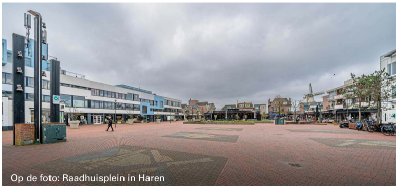
Op de foto: Raadhuisplein in Haren

De gemeente Groningen en winkeliers in het centrum van Haren willen het winkelstraatje Brinkhorst en een gedeelte van de Rijksstraatweg vergroenen. Het gaat om het stuk in de buurt van het Raadhuisplein. Ook moeten parkeerterreinen zoals Voorhorst beter vindbaar worden, zodat bezoekers van het centrum van Haren hier parkeren, en niet op plekken waar dat niet mag. Maandag 21 oktober van 17:00 tot 20:00 uur is er een inloopbijeenkomst in het voormalige gemeentehuis van Haren (Raadhuisplein 10), waar we de eerste tekeningen voor deze straten laten zien. Dan wordt ook het voorkeursontwerp voor het Raadhuisplein gepresenteerd.