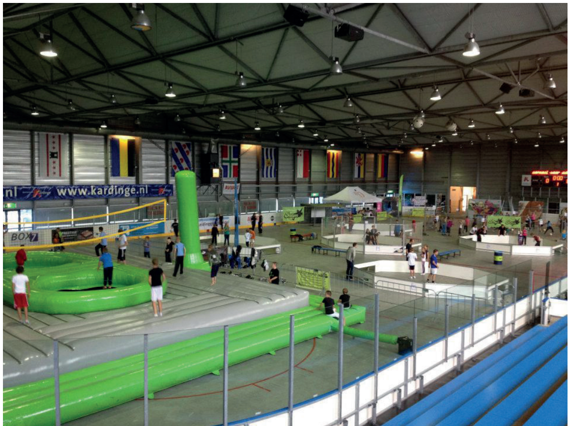
Playground Pannavoetbaltoernooi, IJshal

Omdat sportcentrum Kardinge juridisch gezien een inrichting is, is de wet Milieubeheer van toepassing op deze locatie. Om deze reden wijkt het locatieprofiel sportcentrum Kardinge af van de overige locatieprofielen.