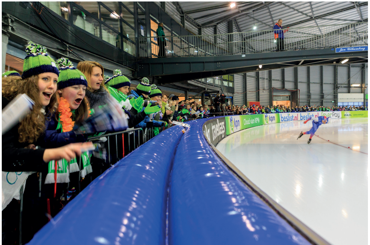
400m baan sportcentrum Kardinge, NK Sprint 2015

In de praktijk is gebleken dat een profiel een goed instrument is dat een overzicht van de mogelijkheden van de locatie en richtlijnen voor het gebruik ervan geeft.