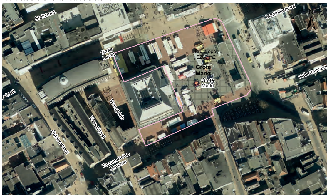
Luchtfoto evenementenlocatie Grote Markt

Met de Grote Markt beschikken wij over circa 6400 m 2 aan bruto evenementenlocatie in het hart van de stad. De inzetbare ruimte verschilt per evenement en is onder andere afhankelijk van de gebruikte opstelling op het terrein, het type evenement en de noodzakelijke gezondheids- en veiligheidsmaatregelen.