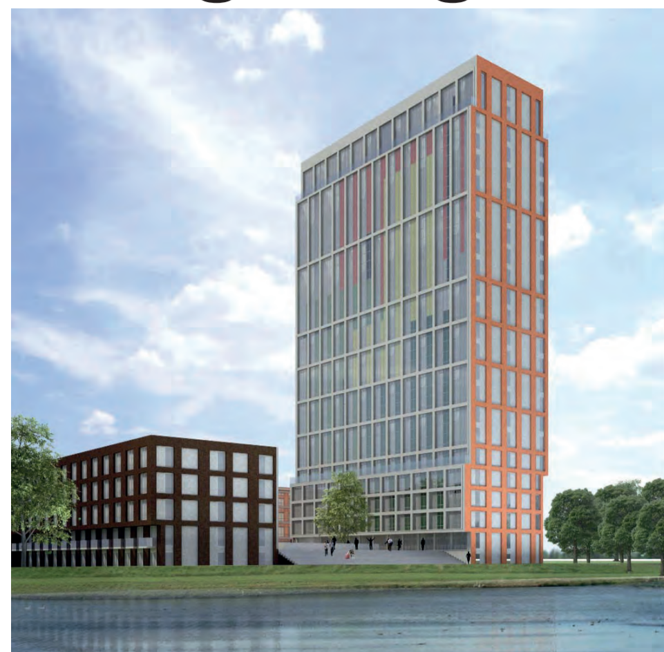
672 studio's- deels shortstay