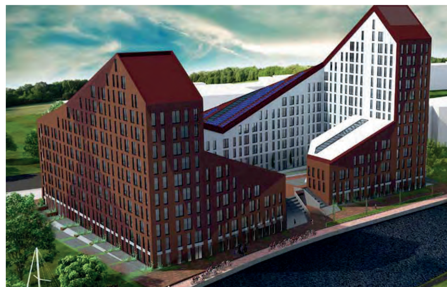
416 studio's Jongeren