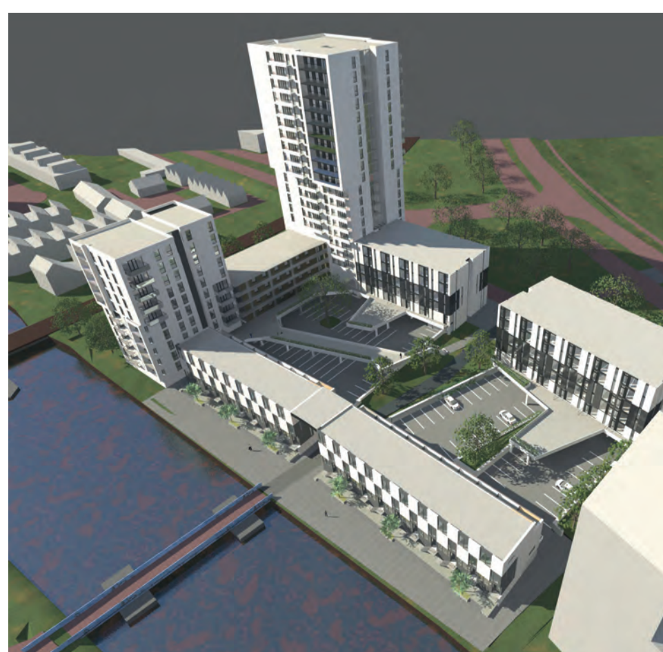
267 appt, 19 kadewoningen, huur