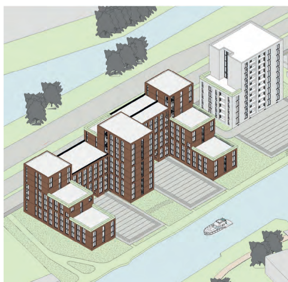
70 soc. huur, 538 studio's jongeren