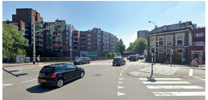
Kruising Eelderweg - Paterswoldse weg

De Eeldersingel wordt als druk en gevaarlijk ervaren. In verband met de aanleg van de zuidelijke ringweg konden er geen verlichtende maatregelen worden genomen. Deze locatie heeft namelijk een belangrijke functie in de afwikkeling van verkeer. Nu de zuidelijke ringweg bijna af is, komt het moment om te kijken welke maatregelen uitgevoerd kunnen worden die bijdragen aan een verbetering van de leefbaarheid.