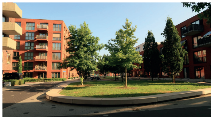
Openbare ruimte Grunobuurt

Na de wijken Corpus den Hoorn en Hoornse Meer gaan we in 2025 met de bewoners aan de slag om kunst in de openbare ruimte te realiseren in de Grunobuurt en de Rivierenbuurt. Enerzijds richt dit project zich op verfraaiing van de bestaande openbare ruimte. Anderzijds richt het project zich op het stimuleren van ontmoeten en versterken van de sociale cohesie.