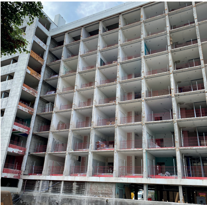
Verbouwing van de studentenflat in volle gang

Lefier is druk bezig met het renoveren en verduurzamen van de studentenflat aan de Van Heemskerckstraat. De kamers worden vergroot en krijgen een eigen toilet en douche. Er komen 36 kamers bij. Daarvoor wordt de flat aan zowel de voor- als de achterzijde een stuk uitgebouwd. Samen met Philadelphia, bewoners(organisatie) en de gemeente wordt gezocht naar een geschikte maatschappelijke invulling van de ruimte op de begane grond. Ontmoeting is daarbij een belangrijk thema, maar ook ruimte voor maatschappelijk relevante dagbesteding.