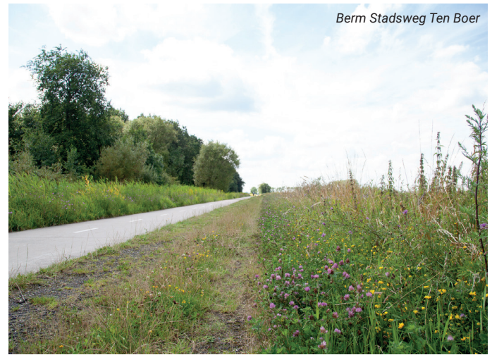
Berm Stadsweg Ten Boer

Het streven is daarnaast om in 2025 plek te bieden aan de eerste kandidaten in het werk-leertraject dat we in samenwerking met SWO (Samen Werkende Ondernemers Sight Landscaping, Van der Werf groenvoorzieningen, en Oosterhof Holman) en DC Terra opzetten. Om bewoners in het gebied te betrekken bij de planvorming, uitvoering en uiteindelijk langdurige ontwikkeling, hebben we in 2024 de eerste bijeenkomst in Thesinge georganiseerd. In 2025 zetten we dit voort in de 8 andere dorpen, waarbij we de vorm afstemmen op de behoeftes per dorp.