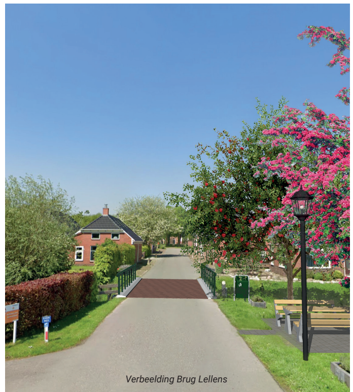
Verbeelding Brug Lellens

In het voorjaar van 2023 is, samen met het gebiedsteam Ten Boer en het dorp, gestart met het ontwerpproces. Door ziekte heeft dit proces helaas wat vertraging opgelopen. In het voorjaar van 2024 heeft een nieuwe landschapsonwerper het project opgepakt en in november 2024 is het ontwerp definitief gemaakt. De uit te voeren maatregelen bestaan voornamelijk uit het pluksgewijs toevoegen van groen, het terugbrengen van authentieke dorpse elementen in het straatbeeld zoals verlichting en parkeerpaaltjes, het aanbrengen van een klinkerafdruk op verschillende plekken in het asfalt om verkeer te remmen, en de verbetering van groene ontmoetingsplekken. De uitvoering vindt in de eerste helft van 2025 plaats.