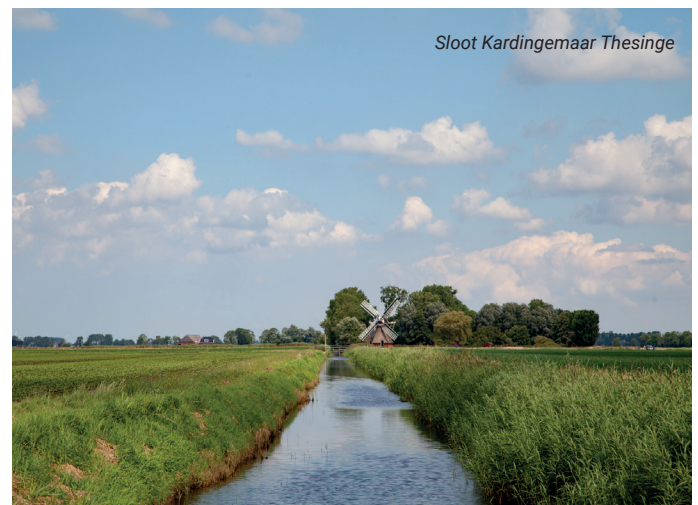
Sloot Kardingemaar Thesinge