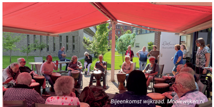
Bijeenkomst wijkraad.