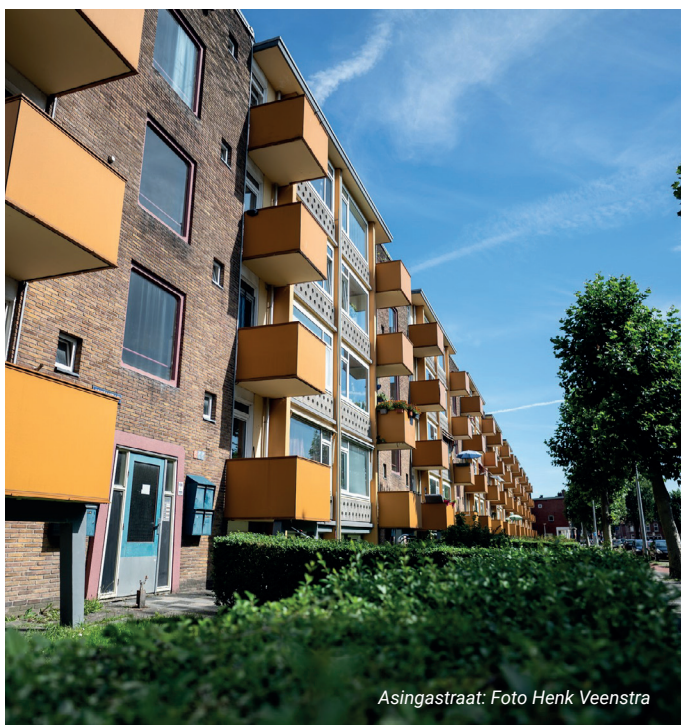
Asingastraat: Foto Henk Veenstra

Er worden 160 woningen in de Asingastraat vervangen. De woningen zijn klein, gehorig en de veiligheid voldoet niet aan de eisen van deze tijd. De Huismeesters bouwt 160 nieuwe, toekomstbestendige en energiezuinige woningen op de plek van de oude woningen. Het is ingrijpend als je hoort dat je woning wordt gesloopt. Daarom ondersteunen we samen met De Huismeesters de mensen die aan de Asingastraat wonen zo goed mogelijk. De sloop start in de zomer van 2025. We verwachten dat de nieuwe woningen in de zomer van 2027 worden opgeleverd.