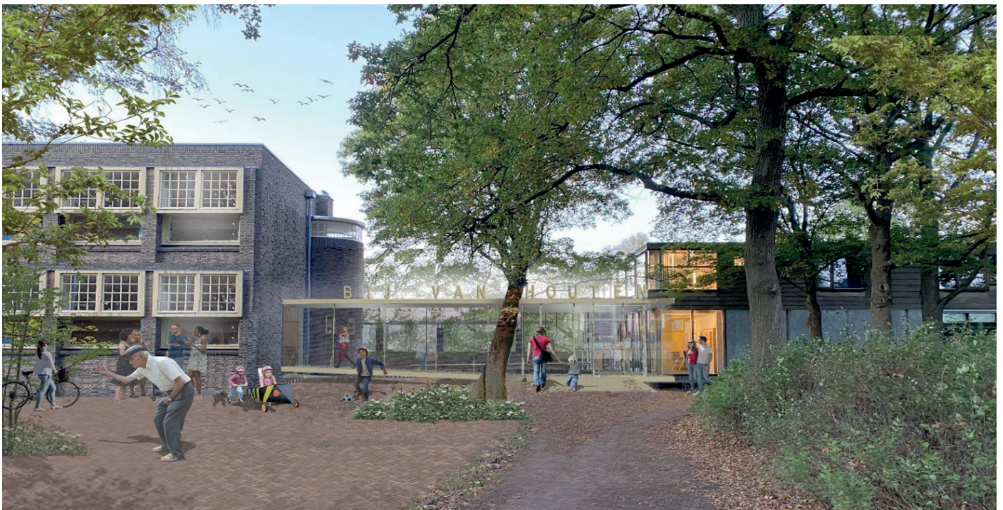
ontwerp Van Houten verbouwing

In 2025 start de verbouwing van Bij Van Houten! De verbouwing kent een lange aanloop. In hun visie en tevens noodkreet 'Wij hebben een droom - Het buurtcentrum dat de Oosterpark verdient', beschreef de wijk al in 2017 dat zij de Van Houtenschool als unieke kans zien voor de huisvesting van een nieuwe en bruisende buurtaccommodatie. Nu gaan we de voormalige Van Houtenschool en de voormalige Vensterschool Oosterpark transformeren tot het nieuwe bruisende hart van de Oosterparkwijk. Dit doen we door verduurzaming, renovatie en het verbeteren van de toegankelijkheid. Bovendien verbinden we beide gebouwen met elkaar door het plaatsen van een glazen verbindingsgang. Dit wordt de nieuwe en uitnodigende entree. Verder komt er ook nog een nieuwe keuken om goede horeca mogelijk te maken. Tot slot hebben we aandacht voor de sociale veiligheid na de verbouwing, zodat het buurtcentrum goed en veilig te bereiken is.