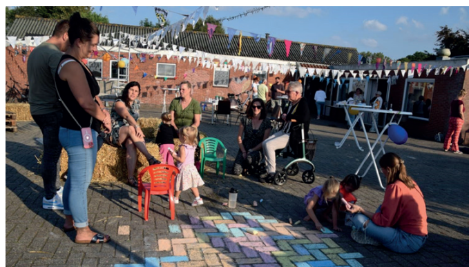
Buurtfeest bij dorps huis Noorderhoogebrug

Het dorps huis is dé ontmoetingsplek voor de circa 300 inwoners van Noorderhoogebrug. Verschillende verenigingen maken gebruik van het gebouw, en er worden tal van activiteiten georganiseerd. Het gebouw is echter sterk verouderd en dringend toe aan verduurzaming. Ondanks dat het dorps huis goed functioneert, vormen onder andere de stijgende energiekosten een flinke kostenpost. De bewoners hebben een bouwcommissie opgericht om het dorps huis te renoveren. Men streeft ernaar om zoveel mogelijk werkzaamheden door vrijwilligers te laten uitvoeren. Vanwege de hoge kosten wordt eerst alleen de buitenkant aangepakt (dak en schil). In het najaar van 2024 zijn er toezeggingen van verschillende fondsen ontvangen, wat betekent dat men voornemens is in het voorjaar van 2025 met de werkzaamheden te starten.