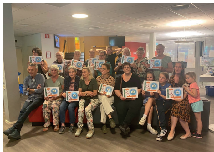
Bewoners bijeen over het wijkbudget voor Lewenborg

Beijum en Lewenborg starten dit jaar voor de vierde keer met het Wijkbudget, waarmee bewoners actief betrokken worden bij hun leefomgeving. Ze kunnen ideeën indienen en meebeslissen over welke projecten uitgevoerd worden. Met het Wijkbudget zijn al veel mooie initiatieven mogelijk gemaakt. In 2024 hebben de betrokken bewoners door middel van een evaluatie gekeken wat er beter kan en ook voorbeelden uit andere delen van Groningen en steden onderzocht. Met de nieuwe inzichten en afhankelijk van de behoefte en mogelijkheden, werken we aan de verbetering van de Wijkbudgetten.