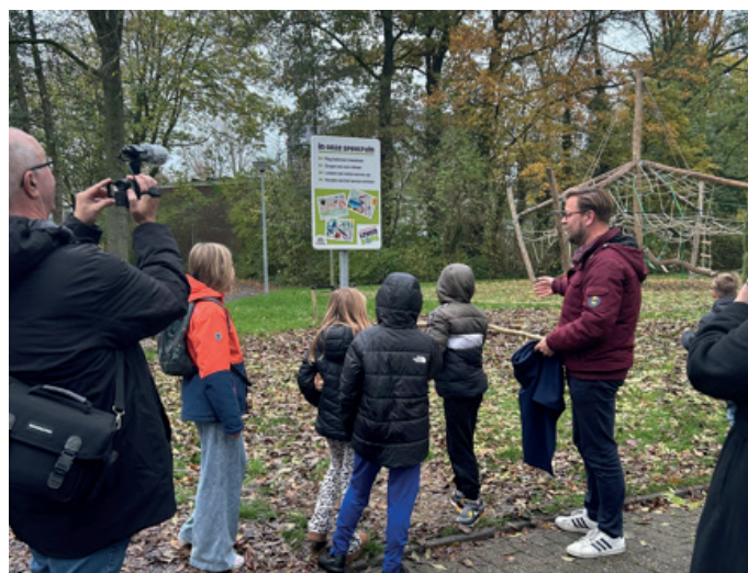
Opening speeltuin aan de Baken