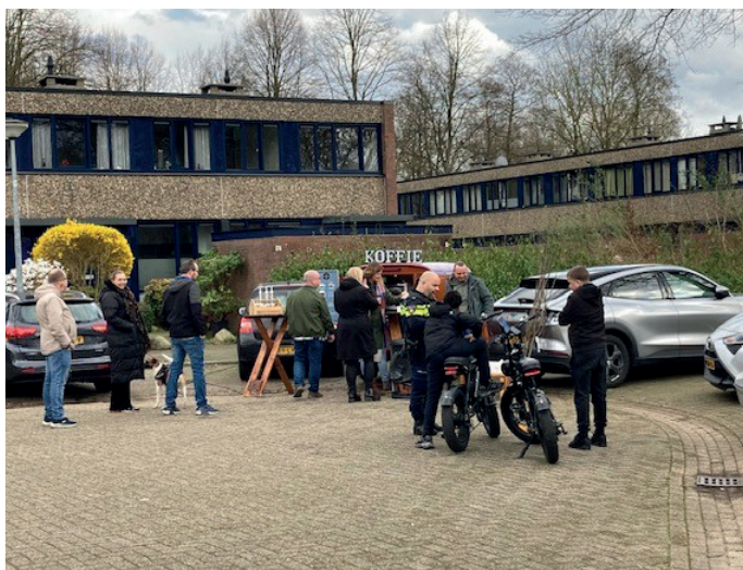
Bakje koffie in de wijk

In 2025 gaan we door met deze aanpak en versterken we die door samen te werken met initiatieven als Kansrijk Groningen (buddy's) en Positief Opgroeien (brugfunctionarissen), zodat problemen vanuit één plan en in samenhang worden aangepakt. Ook kijken we samen met bewoners hoe de kwaliteit van de openbare ruimte verder kan verbeteren met meer groen, speelruimte en ontmoetingsplekken. De pilot dient als basis voor een toekomstige, bredere uitrol van de stratenaanpak in Lewenborg.