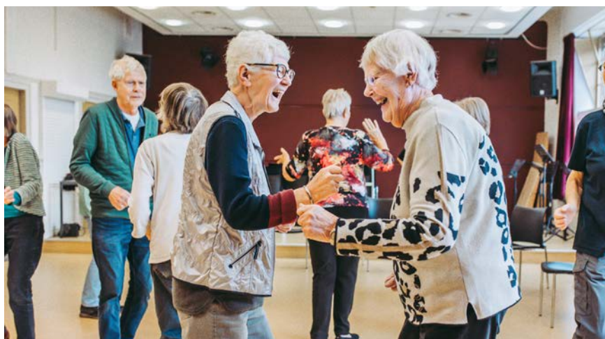
bijeenkomst kom in beweging

Elke vijf minuten belandt er in Nederland een 65-plusser op de spoedeisende hulp na een val. Een val voorkomen is dus beter dan genezen. Bewegen speelt een belangrijke rol om te werken aan vitaal ouder worden. De gemeente verzorgt in de verschillende wijken en dorpen voorlichtingsbijeenkomsten en biedt beweegprogramma's aan om vallen te voorkomen. In januari 2025 start in Haren de eerste voorlichtingsbijeenkomst over de verschillende beweegprogramma's om het valrisico, spierkracht en evenwicht te meten. Deze programma's worden begeleid door fysiotherapeuten. De voorlichtingsbijeenkomst is gratis en aanmelden is niet nodig. Voor de beweegprogramma's is aanmelding wel nodig. Er zijn geen kosten aan de cursus verbonden. Zie voor meer informatie www.gemeente.groningen.nl/voorkomvallen .