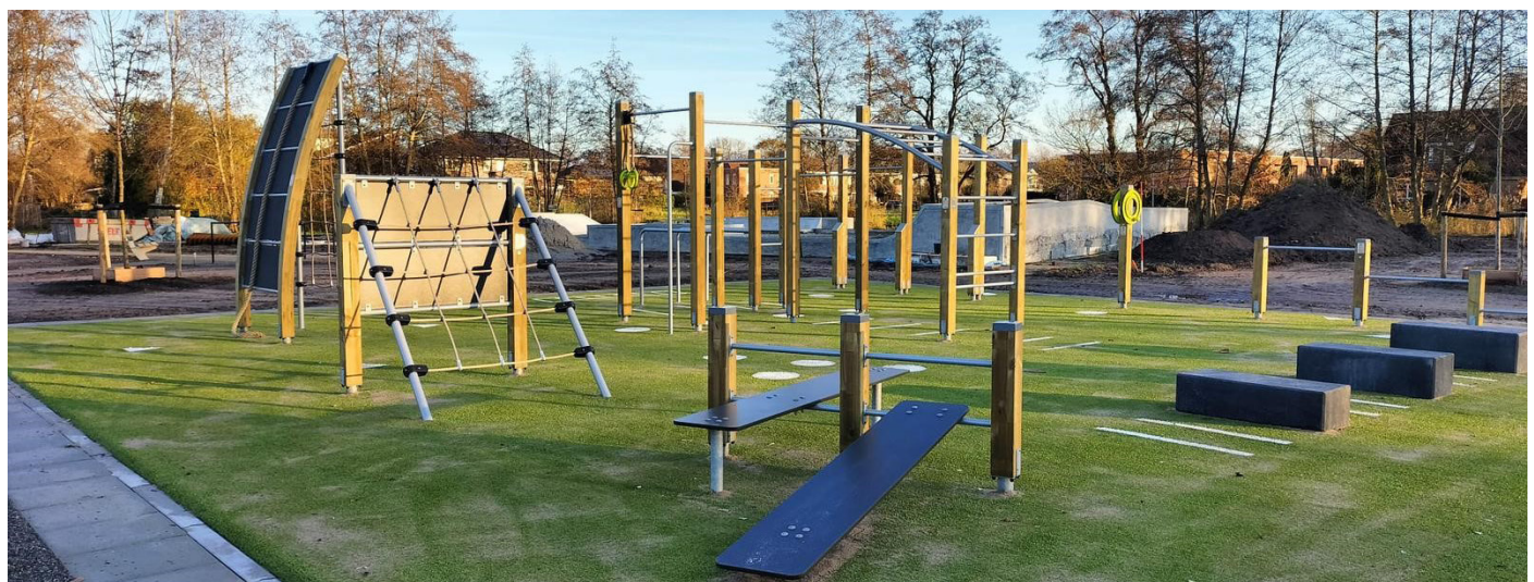
Calisthenics circuit Mikkelfhorst

Eind 2024 is, na een geruime periode van overleg met jongeren en de buurt, gestart met de aanleg van de skatebaan en het calisthenics circuit bij de Mikkelfhorst. In het voorjaar 2025 wordt het complex feestelijk geopend.