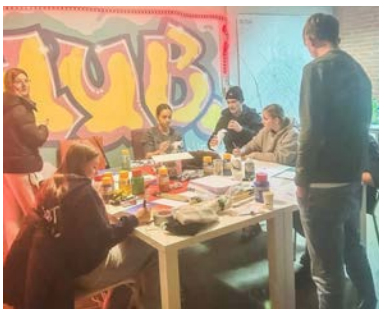
open atelier bijeenkomst

In 2025 gaan we door met het vormgeven van een inloopatelier. We zijn hier in het najaar van 2024 mee gestart in de 'HUB' in Haren. Het open atelier is een plek voor jongeren, die onder artistieke begeleiding hun creatieve talenten kunnen ontdekken. Het is ook een ontmoetingsplek voor de jeugd. Er is gestart met twee verschillende begeleiders, met één van hen gaan wordt het atelier verder ontwikkeld. De jongeren kiezen zelf welke kunst ze willen maken. Het open atelier werkt intensief samen met de jongerenwerkers van de Jeugdsoos de Hang-Out in de Mellenshorst in Oosterhaar.