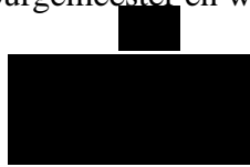
burgemeester Koen Schuiling

Met vriendelijke groet, burgemeester en wethouders van Groningen,