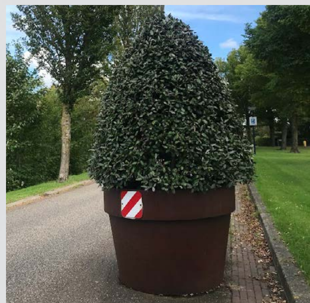
Bijvoorbeeld een Eleagnus ebbingel

In plaats van de bestaande plantenbakken, nieuwe plantenbakken plaatsen die minder zwaar zijn. Door ze op plekken neer te zetten met weinig ondergrondse mogelijkheden, kunnen zelfs hier grotere gebaren gemaakt worden. Kies dan ook voor droogtetolerante groenblijvende heesters en het effect is jaarrond.