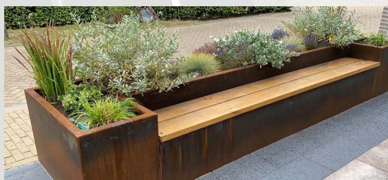
Bijvoorbeeld Hypericum, Rudbeckia en siergrassen.