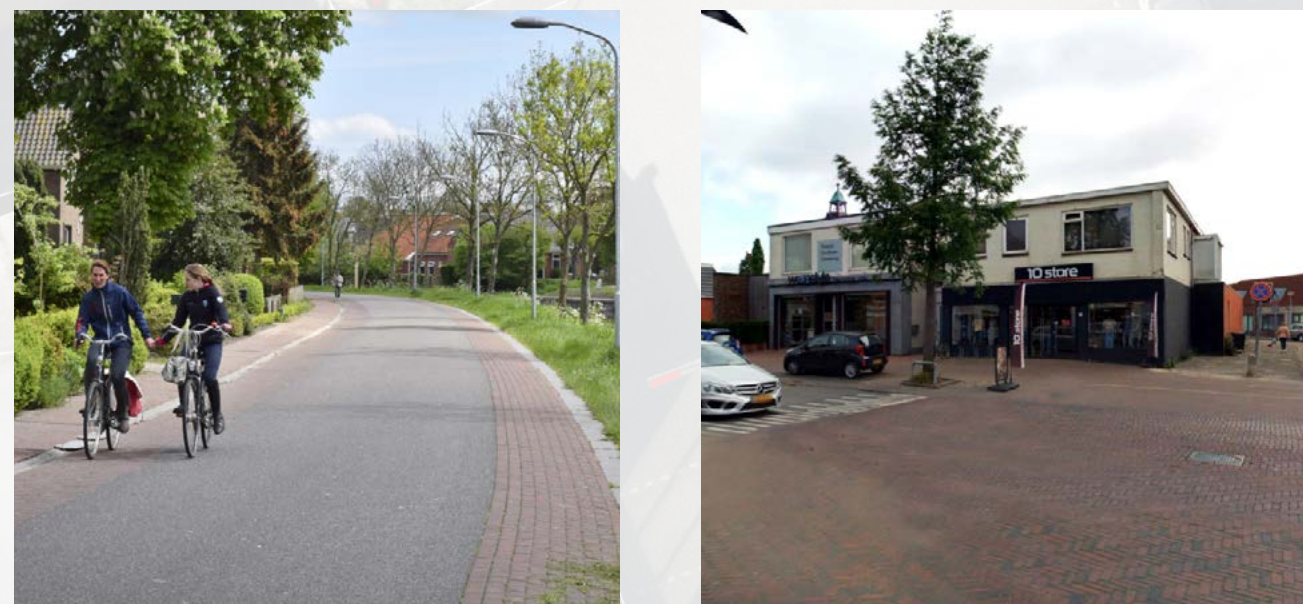
Rode klinkers als rabatstroken zoals LAOS toepaste in Garrelsweer

De rijbaan optisch versmallen en een éénduidigheid en helderheid voor de kruisingen.