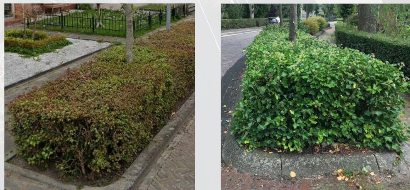
In plaats van esdoornhagen in de Zuiderweg, kan er bijvoorbeeld ook gekozen worden voor groenblijvende en minder onderhoudsintensieve Hedera hagen.

Het dorpskarakter van Hoogkerk wordt mede bepaald door de hagen in bijvoorbeeld de Zuiderweg. Door langs de Zuiderweg ook hagen toe te passen, wordt dit beeld versterkt.