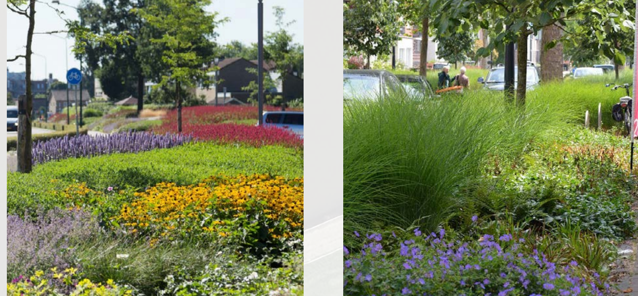
Kies er bijvoorbeeld voor om siergrassen langs de rijbaan te zetten en bloeiende vaste planten naar de voetgangerszone te richten.

Zonder het ontwerp van de sharedspace over de hoop te halen, kunnen binnen de vierkanten ook vaste planten deelnemen aan het verkeer. Met ruimte voor de jaarlijkse kerstboom