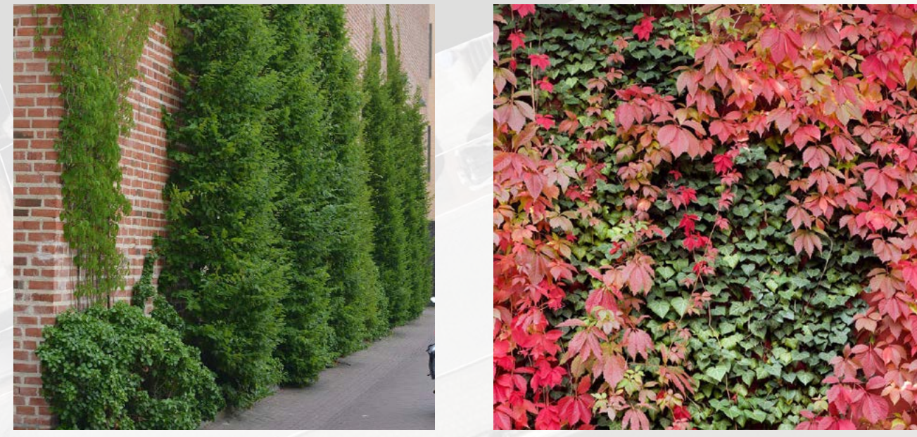
Bijvoorbeeld Parthenocissus quinquefolia "Engelmannii", Parthenocissus tricuspidata en aan de voet Hedera hibernica "Irish Arborescent"

Op prominente zichtlocaties, kunnen klimplanten een blinde muur doen leven.