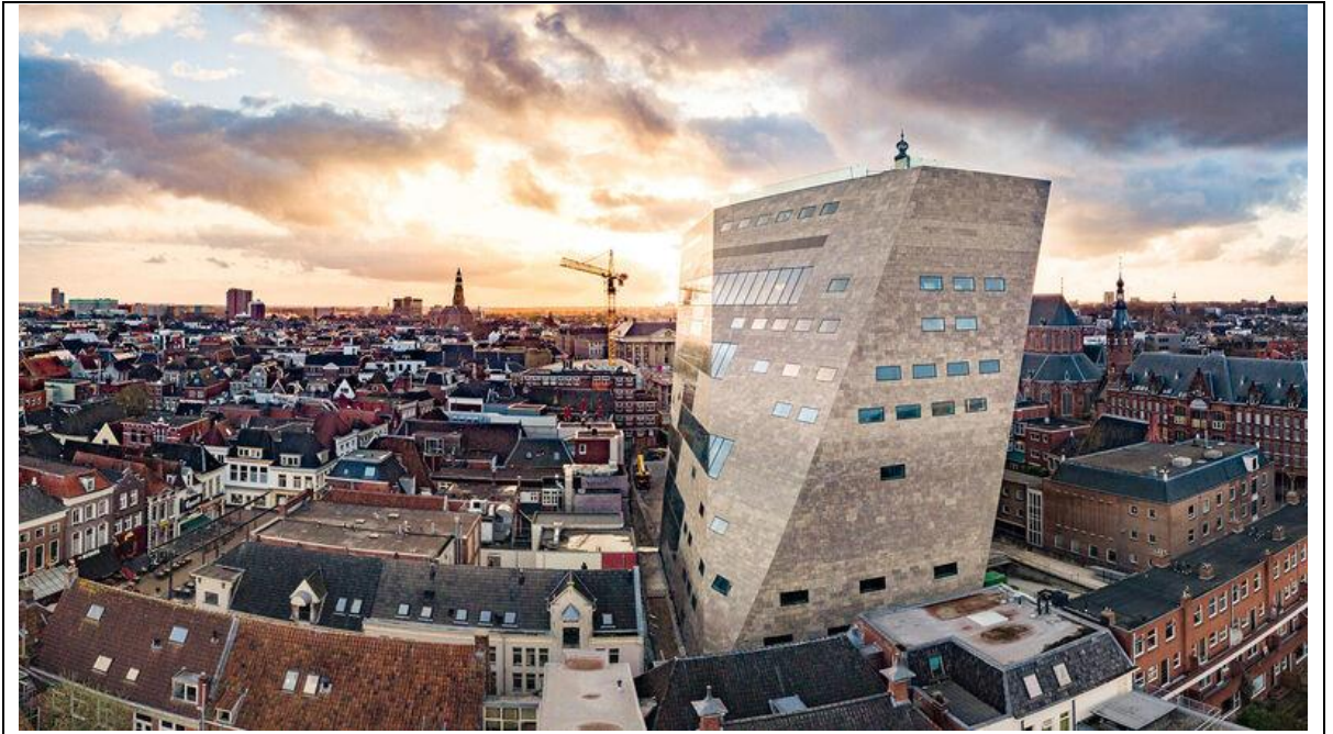
Figuur 4 Het Groninger Forum

Het verzoek om schadevergoeding, voor zover van belang voor deze second opinion, heeft betrekking op de uitvoering van de werkzaamheden ten behoeve van de realisatie van het zogenaamde Forum-project in Groningen in de boekjaren 2017 tot en met 2019.