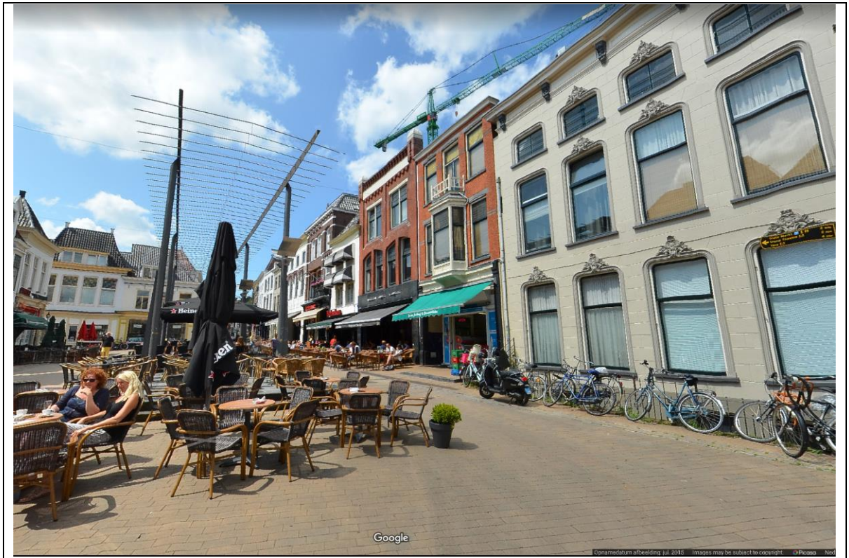
Figuur 3 Bedrijf verzoekers