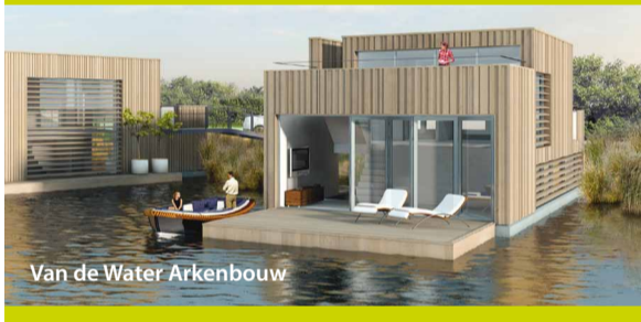
Van de Water Arkenbouw