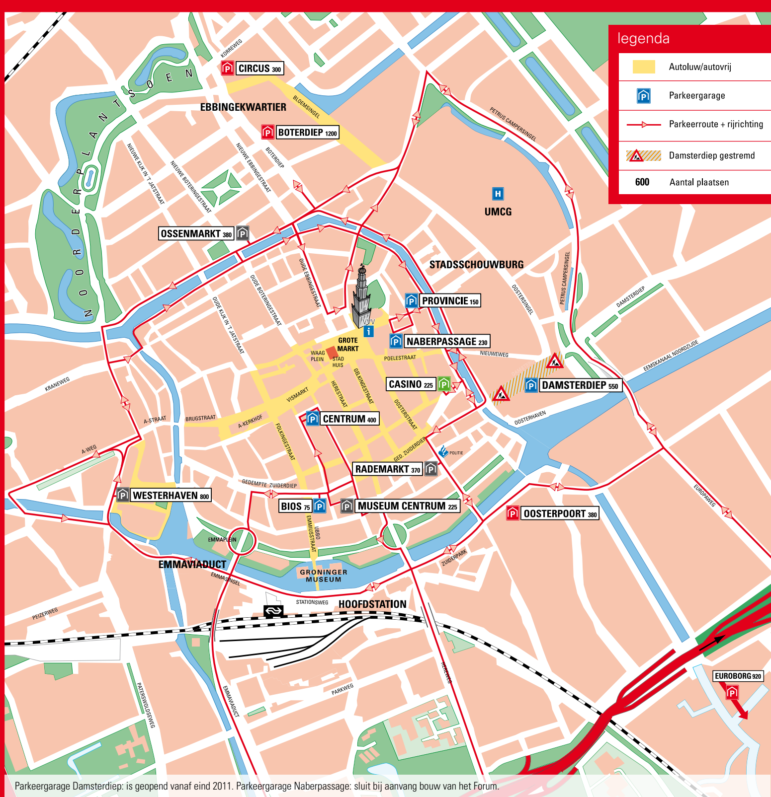
Parkeergarage Damsterdiep: is geopend vanaf eind 2011. Parkeergarage Naberspassage: sluit bij aanvang bouw van het Forum.