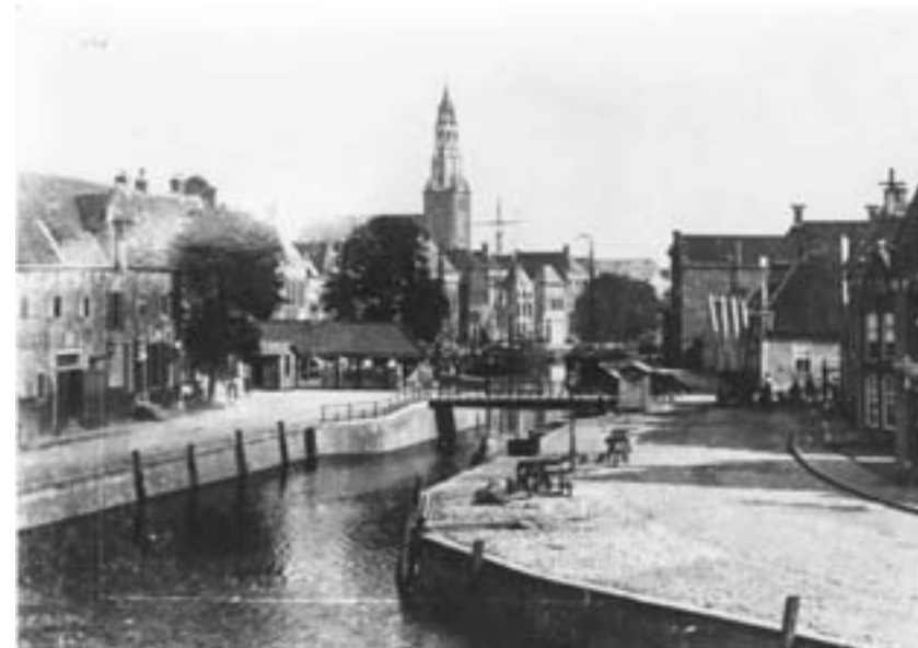
Groningen stad aan het water